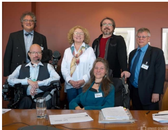
2- Rencontre avec la ministre Blais, février 2019

Nous sommes toujours considérés comme des patients vulnérables, gravement malades, voire même en fin de vie et il n'est aucunement considéré que nous puissions participer activement à la société comme des citoyens ordinaires. De ce fait, toutes les règles et les lois du système de santé régissent nos vies.